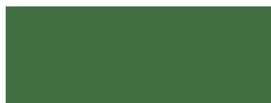
Grün / Verde