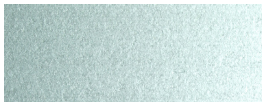
Silver / Argintiu