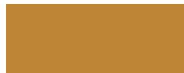
Ocker / Ocru