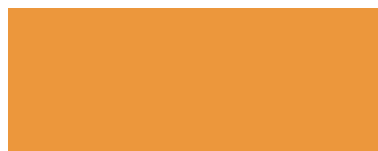
Orange / Portocaliu