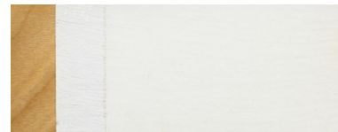
Weiss / Alb