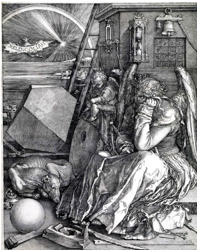
Albrecht Dürer, Melencolia , gravură 1514