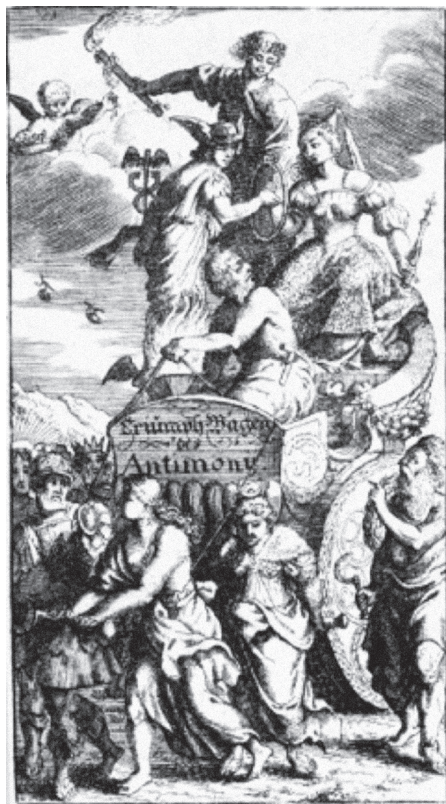
„Carul triumfal al antimoniului“ (frontiscipiu)

aur, calx auri , va dispărea îndată, cu o bubuitură violentă. Fiind apoi tratat cu oțet, manipularea lui nu va mai reprezenta nici un pericol.