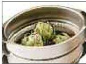
Coș superior cu fund detașabil