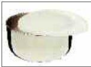
Bol multifuncțional din inox Orez, sosuri, feluri de încălzit