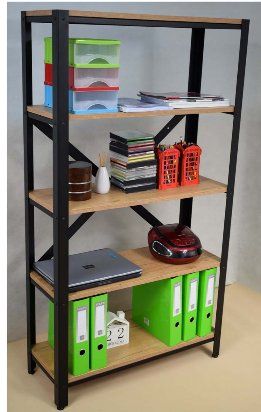
Wyprodukowano w Polsce