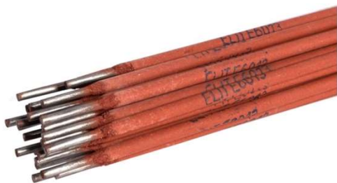
Electrozi AZ 2Kg 2.5x350mm Rutilici Profesional G01