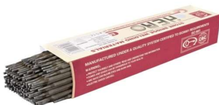
Electrozi Almaz 3.2x350mm Rutilici G01