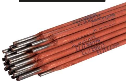
Electrozi AZ 3Kg 3.2x350mm Rutilici Profesional G01