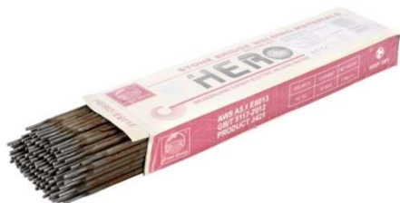
Electrozi Almaz 2.5x300mm Rutilici G01