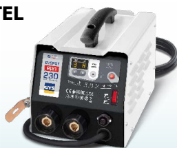
EASYLINER PRO 230 - ref. 072398