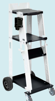
Cărucior DENT 1000 ref. 072848