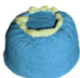
Bloc mic de nisip din Marea Gaură Albastră din Belize