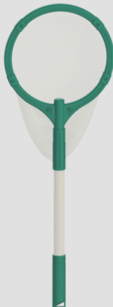
Plasa de aterizare