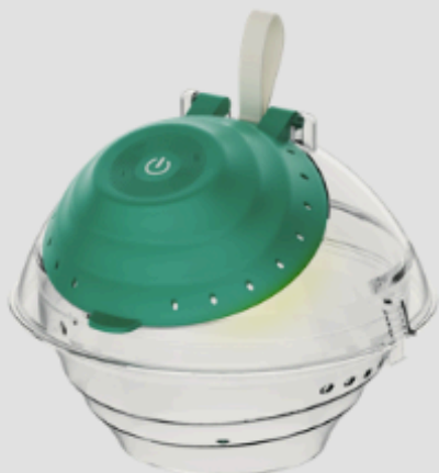
Camera pentru insecte