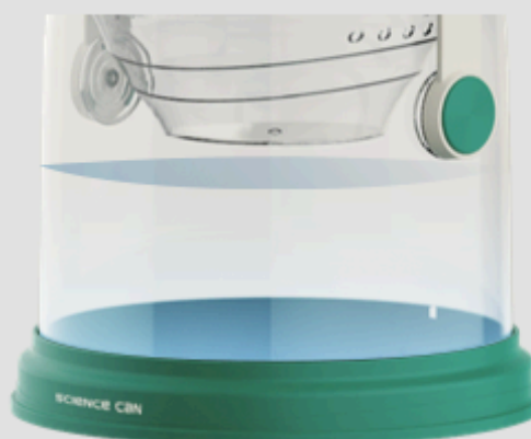
Camera de apă