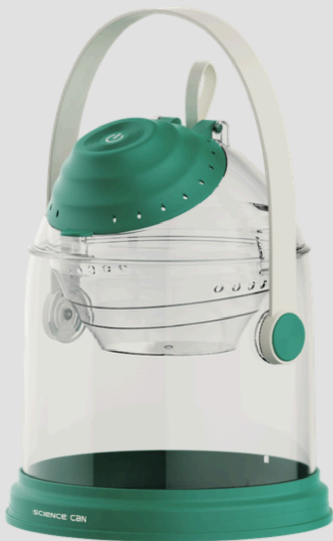
Stație de observare