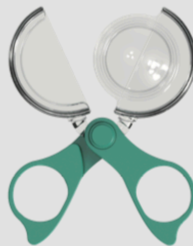
Instrument de prins insecte