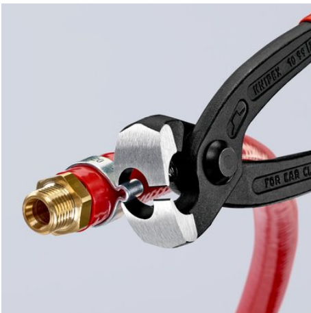
Etanșare furtun pentru fluide pe suport cu ajutorul ciocurilor de prindere laterale

Ne rezervăm dreptul asupra modificărilor tehnice și posibilelor erori.