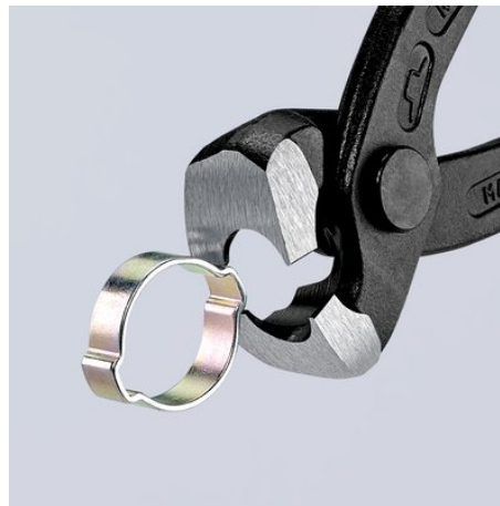
Utilizarea ciocurilor de prindere frontale