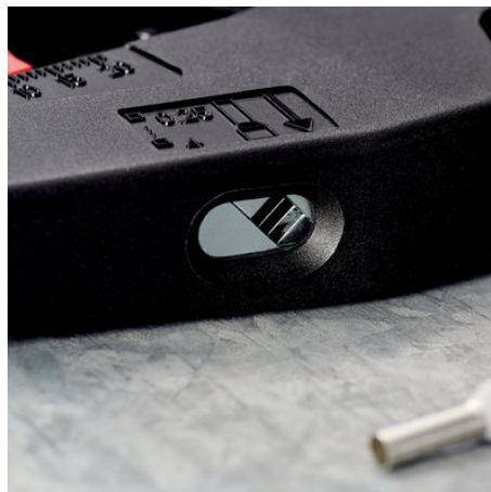
!Die Zwangssperre stellt beim Crimpen immer den perfekten Anpressdruck sich!