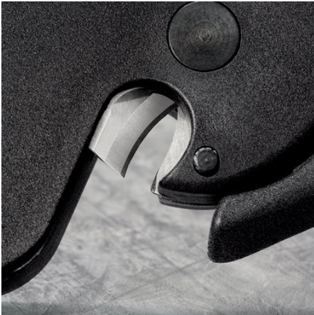
!Mit Kabelschneide für Leiter bis 10 mm 2 !