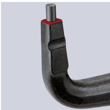
vârfuri stabile, inserate, din o#el de arc ultracompact

Ne rezervăm dreptul asupra modificărilor tehnice și posibilelor erori.