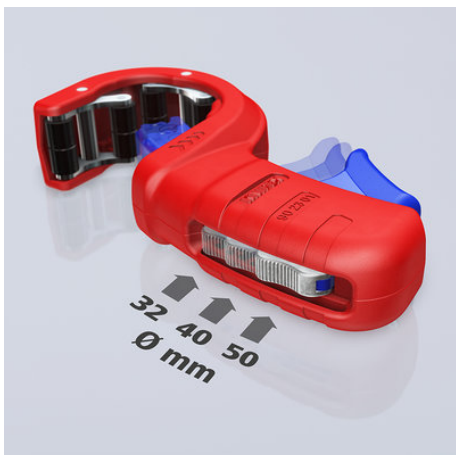
!Drei Durchmesser mit einem Werkzeug: Der Rohrdurchmesser lässt sich mit dem Metallversteller vor einstellen!