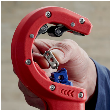
!Wenn die Klinge abgenutzt ist, kann sie ohne Werkzeug gewendet oder ausgetauscht werden!