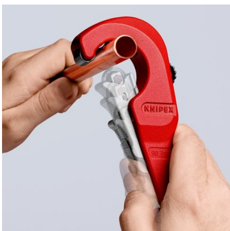
Acum tăierea devine ușoară: a#eaza#i tăietorul KNIPEX TubiX® deschis...