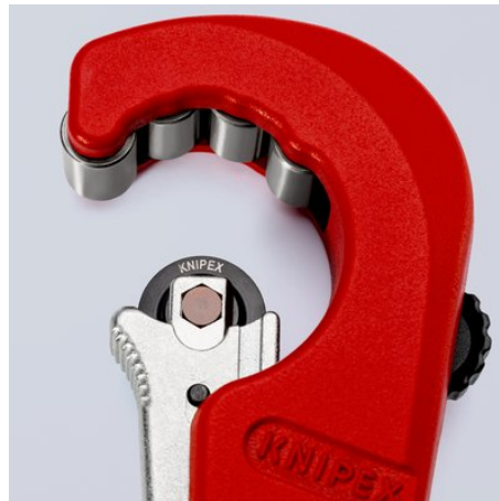
Discul de tăiere cu lagăr din rulmenți cu ace #i pretensionare cu arc este executat din oțel de înaltă calitate de pentru rulmenți #i se poate schimba u#or