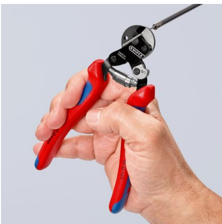
Cu o lungime de 160 mm, mai puternic decât numeroase foarfece pentru cabluri metalice mai mari, în ciuda design-ului compact

Ne rezervăm dreptul asupra modificărilor tehnice #i posibilelor erori.