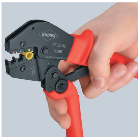
Pasul 1: apropierea unuia din mânere cu două degete până când ambele fălci reazemă pe conectorul de sertizat