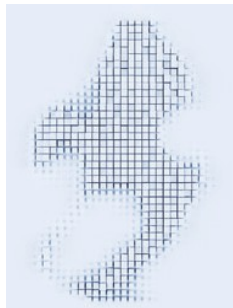
Vizualizarea cu un dermatoscop convențional

Toate lucrurile mărunte contează în timpul examinărilor cutanate. De aceea, am rearanjat LEDHQ pe noul HEINE DELTA 30 PRO. Prin re poziționarea LED-urilor, lumina ajunge în straturile mai profunde ale pielii - oferind o impresie extrem de vie și spațială a leziunilor, similară unei imagini 3D.