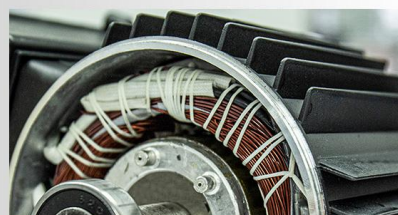
Carcasa motorului din aliaj de aluminiu