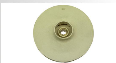
Turbina din PPO(techno-polymer)