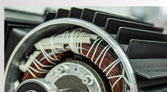
Carcasa motorului din aliaj de aluminiu