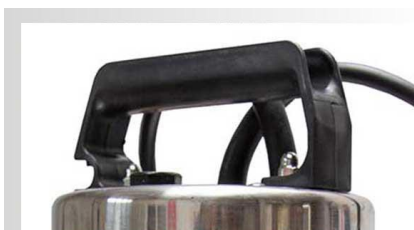
Maner pompa submersibila