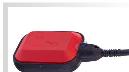
Plutitor de siguranta