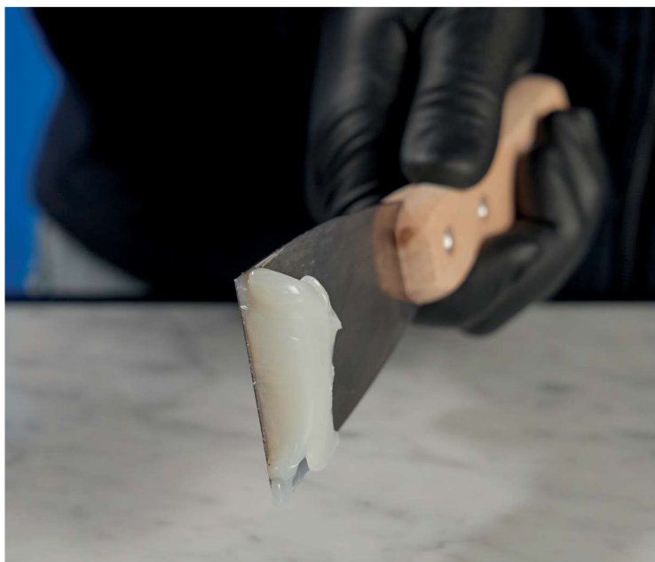
stabilitate pe verticală după amestecare