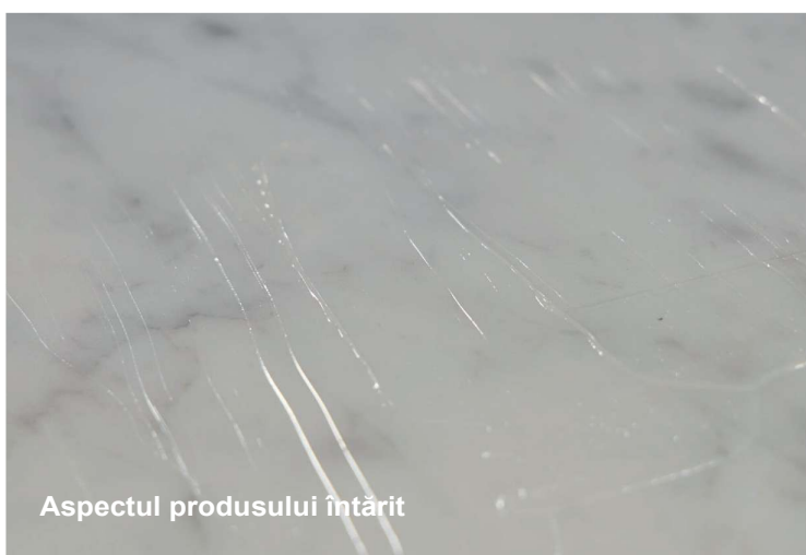
Aspectul produsului întărit