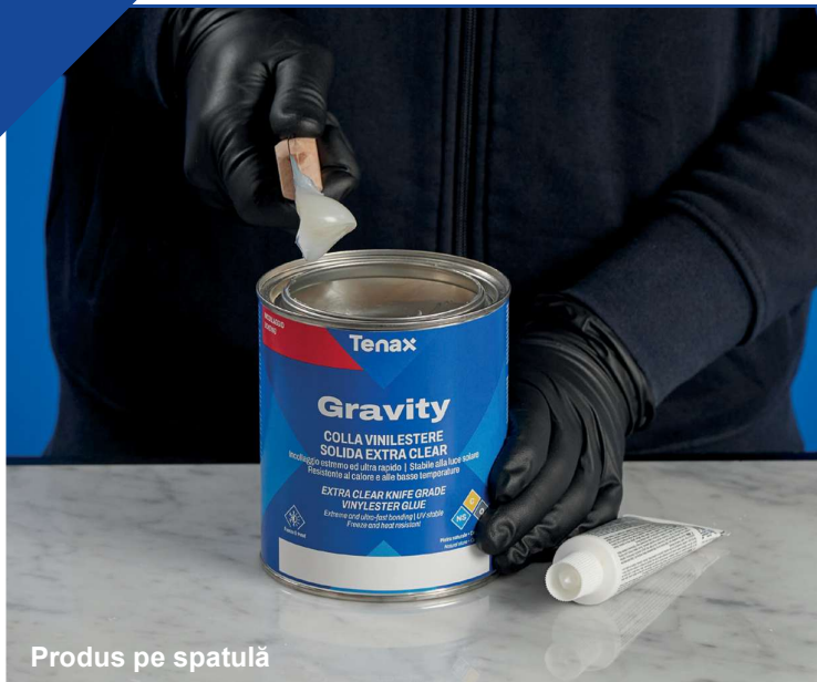
Produs pe spatulă