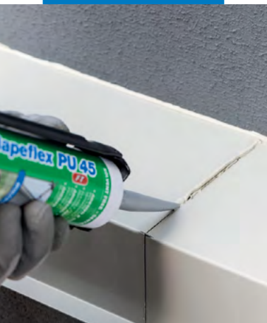
Etanșarea flexibilă a rosturilor de construcții

Mapeflex PU 45 FT se întărește datorită reacției cu umiditatea din atmosferă, transformându-se într-un material cu o bună rezistență în timp. Etanșantul se utilizează pe suprafețe orizontale sau verticale. Produsul este gata de utilizare și se furnizează ambalat în cartușe metalice sau sub formă de batoane în folie de aluminiu, fiind ușor de folosit în practică, aplicarea făcându-se cu un pistol de aplicare adecvat. Datorită consistenței sale, este ușor de pus în operă, are un timp rapid de întărire și poate fi pus în exercițiu la scurt timp de la aplicare, obținându-se în acest fel avantaje economice.