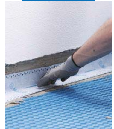
Hidroizolare perimetrala cu Mapeband Easy , lipita cu adeziv Mapeguard WP Adhesive