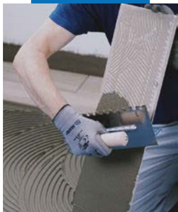
Instalarea ceramicii sau pietrei naturale cu un adeziv Mapei cel puțin clasa C2