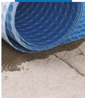
Instalarea Mapeguard UM 35