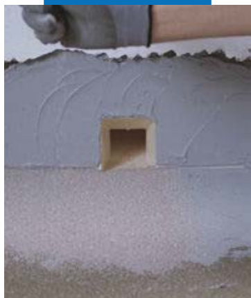
Hidroizolarea scurgerilor cu drain front