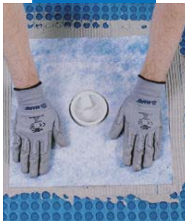
Hidroizolarea scurgerilor cu Drain Vertical/Drain Lateral

Toate referințele relevante despre acest produs sunt disponibile la cerere sau pe www.mapei.com