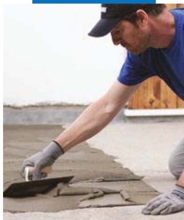
Aplicarea adezivului cu o spatula dintata nr. 5