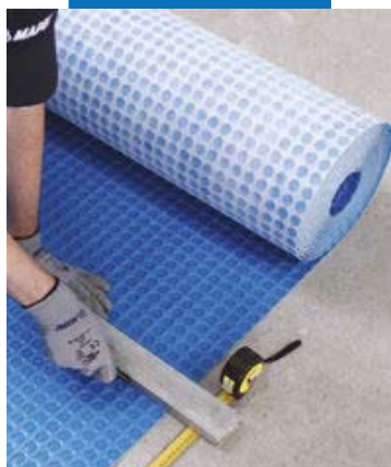
Taierea Mapeguard UM 35