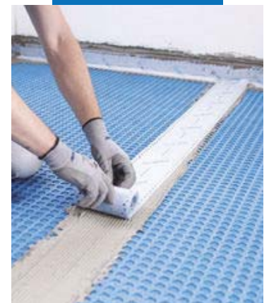
Hidroizolarea rosturilor dintre fasii cu Mapeband Easy , lipita cu adeziv Mapeguard WP Adhesive